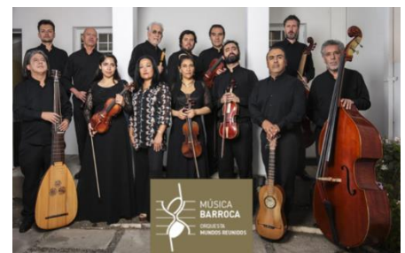
CONCIERTO “LA MÚSICA QUE NUNCA HA DE MORIR”

La Coordinación de Artes y Cultura del Instituto Rafael Ariztía junto a la Corporación Cultural Gustos Reunidos, ofreció un concierto denominado “La Música que nunca ha de morir” con la Orquesta Mundos Reunidos de Valparaíso. Con los acordes de violines, violas, cello, contrabajo, clavecín, sacabuche, flautas y voces, la Orquesta realizó una presentación on line para los amantes de la música barroca la que fue transmitida el jueves 27 de mayo a través del canal de YouTube. El concierto contempló la ejecución de bellas piezas musicales, la presentación estuvo dedicada a la música barroca y ofreció obras de grandes maestros como; Emilio de Cavalieri, Claudio Monteverdi, Darío Castello, Andrea Falconieri, Marco Uccellini, G.Fr. Haendel y Antonio Vivaldi.